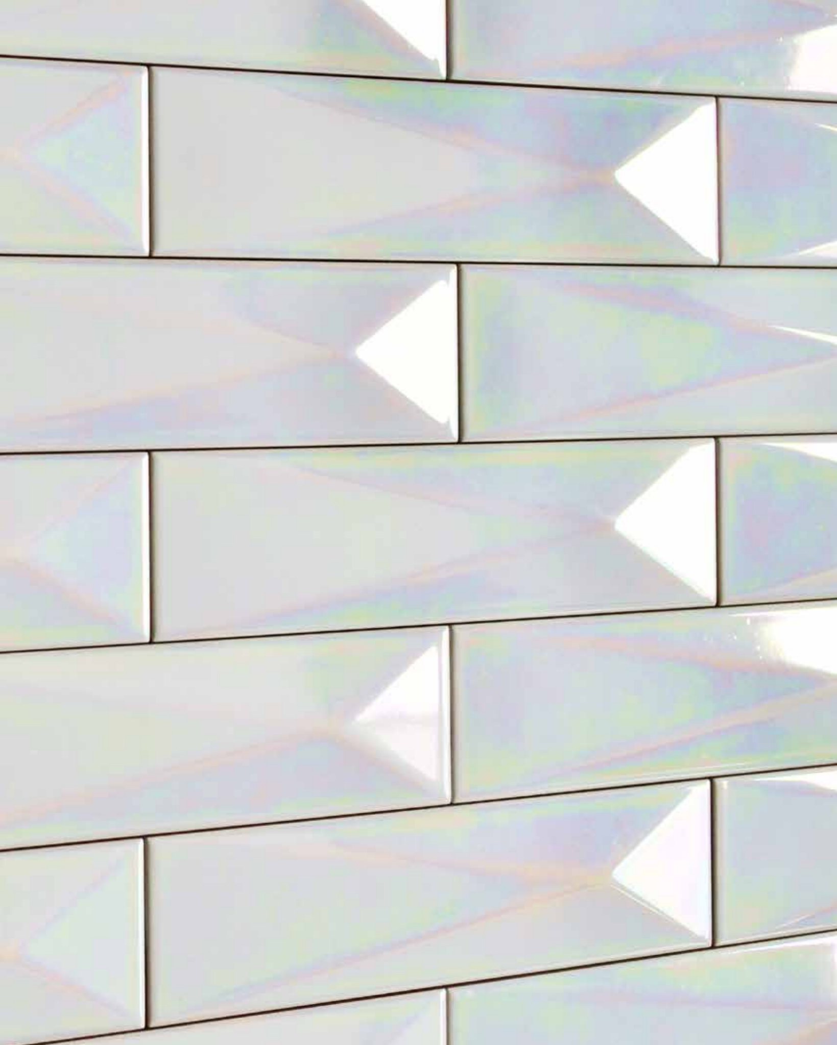
PIRAMIDE B Tridimensionale / Three-dimensional