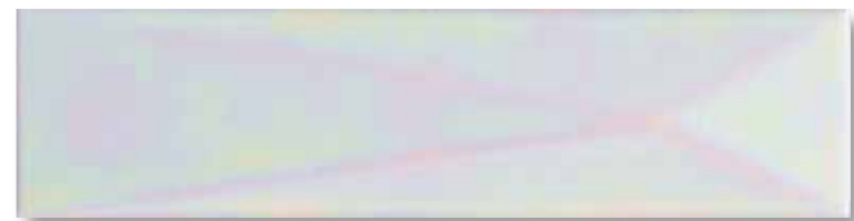
BIANCO LISTRATO MADREPERLA 6,5x26 cm - 2,5"x10"