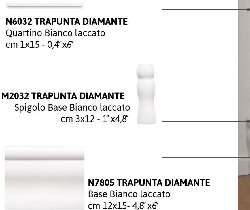
N7805 TRAPUNTA DIAMANTE Base Bianco laccato cm 12x15- 4,8" x6"