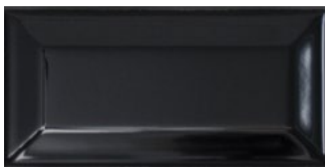
E112 TRAPUNTA DIAMANTE