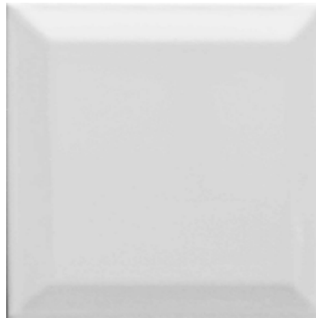
E101 TRAPUNTA DIAMANTE Bianco laccato cm 15x15 - 6" x6"