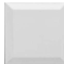
E103 TRAPUNTA DIAMANTE Bianco laccato cm 7,5x7,5 - 3" x3"