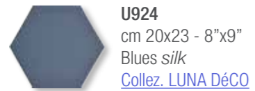
U924 cm 20x23 - 8"x9" Blues silk Collez. LUNA DéCO