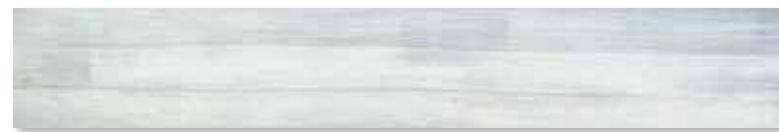
J4602 cm 20x120 - 8"x48" Denim, Collezione CANVAS