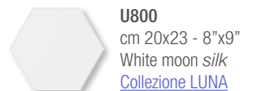
U800 cm 20x23 - 8"x9" White moon silk Collezione LUNA